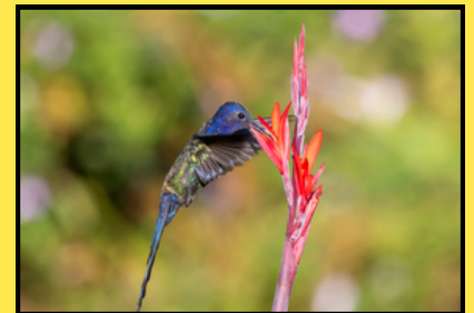
Beija-Flor Tesoura ( Eupetomena macroura )