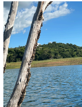
Mexilhões dourados incrustados em troncos expostos na represa.

larvas do mexilhão-dourado na água confirma que a espécie está se reproduzindo ativamente no sistema, garantindo sua permanência ao longo do tempo. A combinação de adultos fixados no fundo e larvas dispersas pela corrente facilita a expansão da espécie e dificulta seu controle natural.