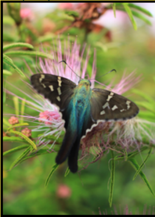
Borboleta da espécie Urbanus proteus

Em meio à expansão urbana e à crescente perda de áreas naturais do Cerrado, tornou-se urgente aproximar a universidade da comunidade para dialogar sobre um tema essencial: a conservação dos polinizadores. Nossa motivação nasce da preocupação com o declínio desses organismos fundamentais e com a